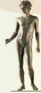
تمثال الفتى الجميل

من بين أجمل منازل هذا الحي، هناك منزل الفتى الجميل، منزل أعمال هرقل، المنزل ذو الأعمدة، ومنزل فينوس وكلها تحتوي على مجموعة من اللوحات الفسيفسائية التي تزين أرضياتها.