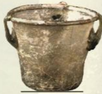
مصباح زجاجي يعود لفترة ما بعد الرومان

يمتد هذا الحي على مساحة 18 هكتارا، ويفصله عن الأحياء الأخرى سور بني بعد هجر الرومان للمدينة. لقد كشفت الحفريات الأثرية التي أجريت في بعض أجزائه عن وجود مجموعة من المنازل الرومانية وحي بالقرب من واد خمان يرجع لفترة ما بعد الرومان، بالإضافة إلى حمام يعود للفترة الإدريسية وبنيات تعود للفترة الإسلامية.