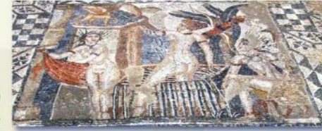
فسيفساء حمام ديانا بمنزل فينوس